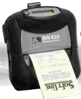
Impresora ZEBRA inalámbrica